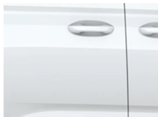
Bílá Frozen nemetallická