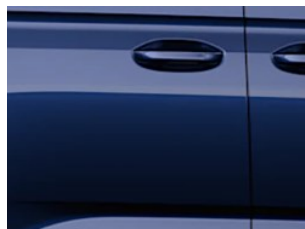
Modrá Midnight metalická