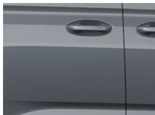
Šedá Comet nemetallická