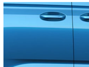
Modrá Boundless metalická