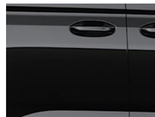
Černá Ink metalická