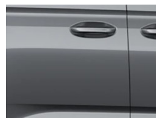
Šedá Graphite metalická

i Pro Titanium jsou dostupné barvy Bílá Frozen, Černá Ink, Stříbrná Stardust, Šedá Graphite, Červená Maple a Stříbrná Dusky. Pro Active jsou dostupné barvy Bílá Frozen, Šedá Graphite, Šedá Comet a Modrá Boundless. Dostupnost jednotlivých barev karoserie se odvíjí od aktuální nabídky centrálních skladových vozů.