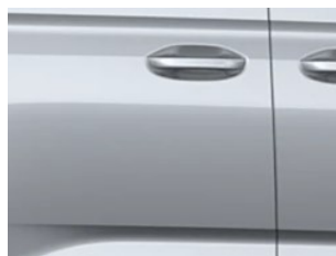
Stříbrná Stardust metalická