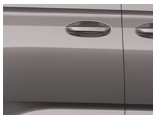
Stříbrná Dusky metalická