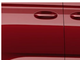
Červená Maple metalická